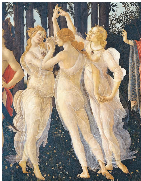
Sandro Botticelli, La primavera , detalle, Uffizi, Florencia