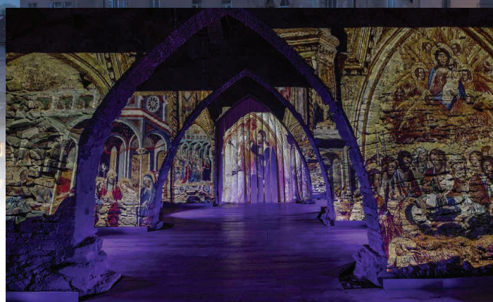
Tempio del Brunello, Montalcino, Siena

Apoyamos a las empresas para realizar de la mejor manera sus estrategias de comunicación y relaciones públicas ambientándolas en espacios únicos y de elevado valor artístico y cultural.