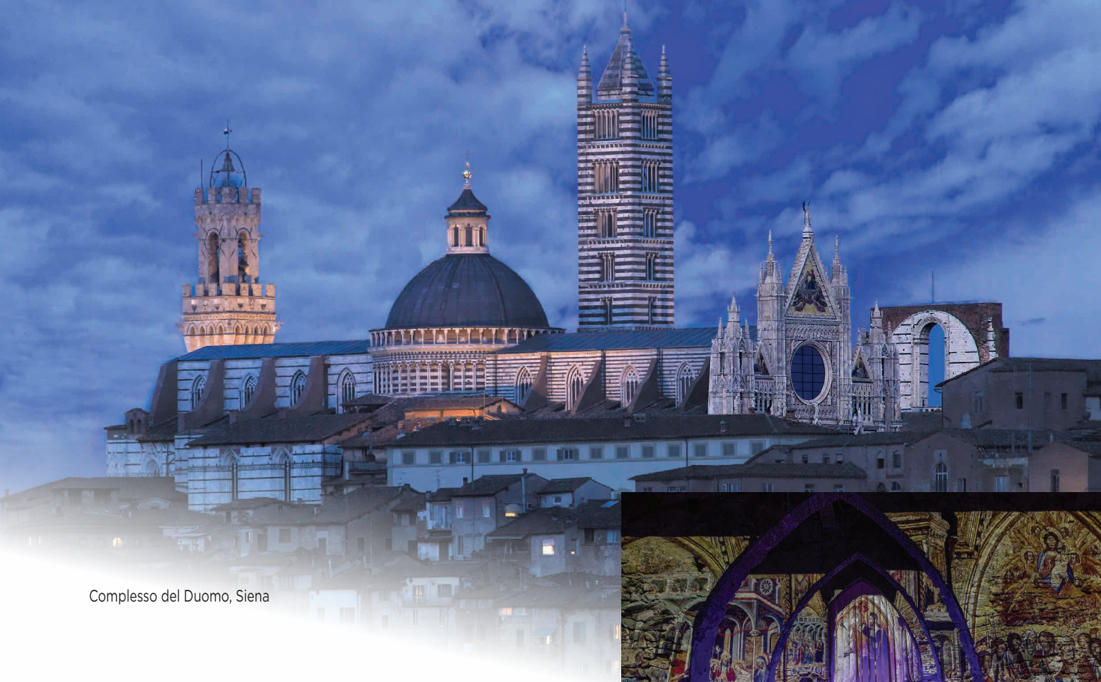
Complesso del Duomo, Siena