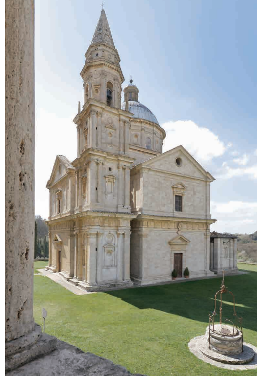
Tempio di San Biagio, Montepulciano, Siena

Los museos más importantes de Italia en Milán, Florencia, Siena, Roma y Nápoles pueden convertirse en localizaciones únicas para eventos exclusivos e irrepetibles.