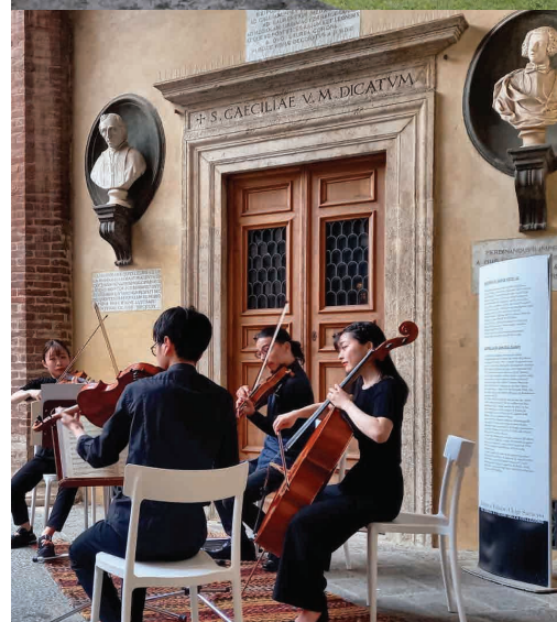
Palazzo Chigi Saracini, Siena

Para reuniones y convenciones empresariales podéis confiar en nuestro staff: idear y realizar un evento, eligiendo la sede más adecuada, para convertirlo en un momento memorable.