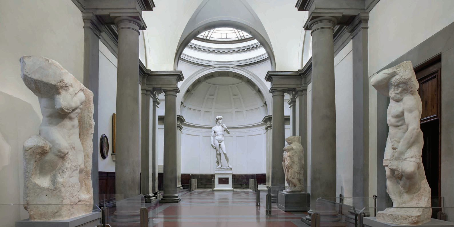
Tribuna del David, Galleria dell'Accademia, Firenze

Obramos en los museos y para los museos con gran pasión y una vasta experiencia adquirida en más de 25 años de actividad, que nos han visto siempre empeñados en “acoger y hospedar”, ofreciendo lo mejor de la cultura italiana.